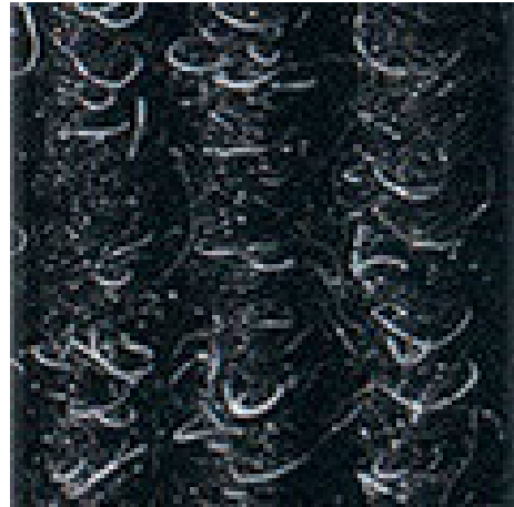
Anthrazit Nr. 200