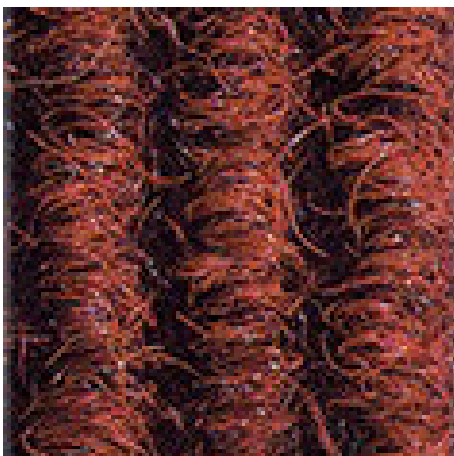
Rot Nr. 305