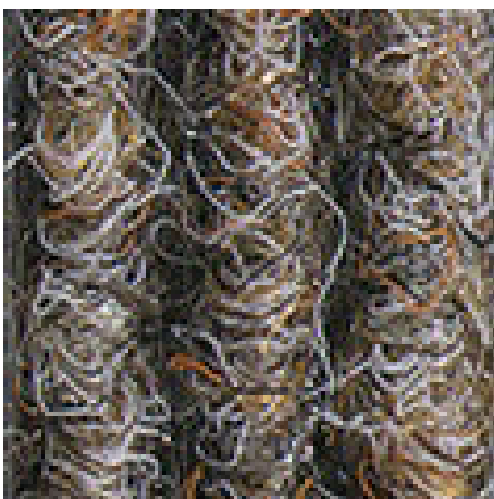
Sand Nr. 430