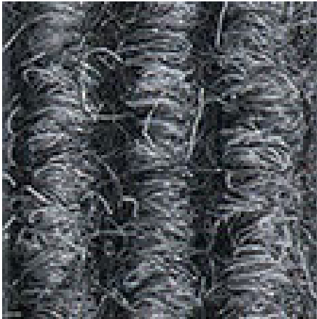
Hellgrau Nr. 220