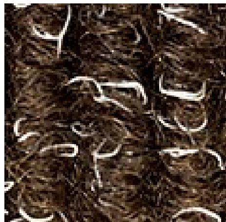
Braun Nr. 485