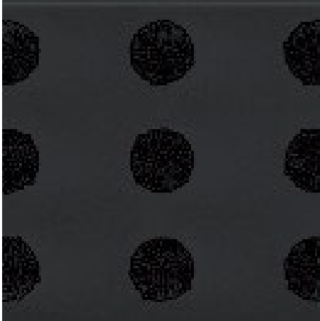
Borstenbündel in Schwarz

Garantiebedingungen finden Sie unter: www.emco-bau.com/de/garantiebedingungen/