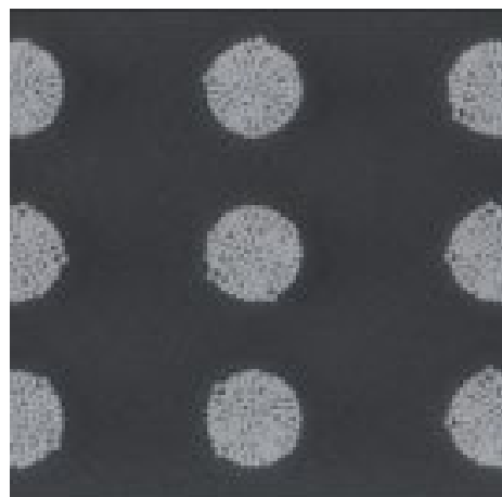
Borstenbündel in Grau